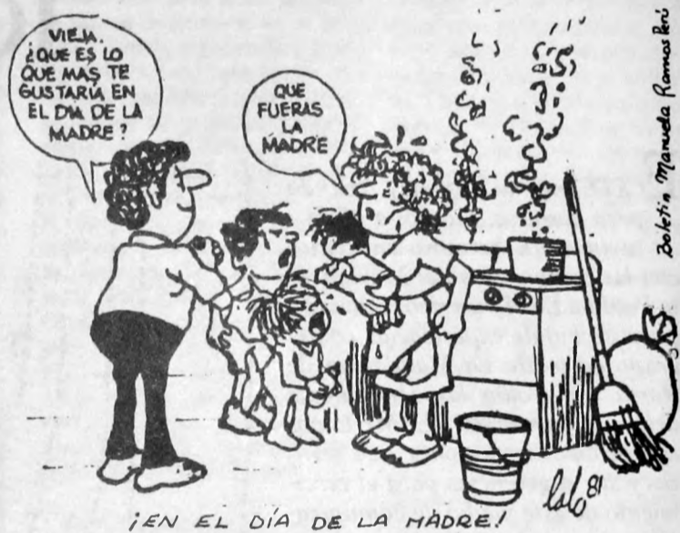
¡EN EL DÍA DE LA MADRE!

Como mujeres denunciamos este uso y manejo de la figura y rol de la mujer y reivindicamos nuestro derecho de ser libres en la maternidad y no objetos de hipócrita veneración y ganancia comercial.